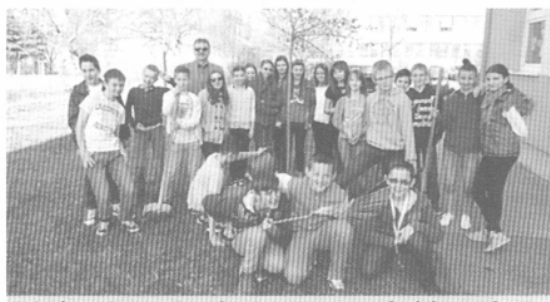
Trieda príma pri sadení stromu na školskom dvore

V apríli 2013 ku „ Dňu Zeme “ sme v rámci akcie „ Očistíme si Slovensko “, zorganizovali brigádu na očistenie životného prostredia Dunajskej Stredy. Tento rok sa akcie zúčastnili trieda príma - všetkých 25 žiakov, trieda tercia – spolu 22 žiakov, trieda sekunda – spolu 23 žiakov. Čistili okolie obchodných centier, neďalekú cyklistickú trasu v Dunajskej Stredy, ale aj okolie školy, ale nie areál – ten udržujeme priebežne a dbáme aj o kvetinovú výzdobu pri kmeňoch stromov pred školou. Žiakov sme motivovali pozorovaním prostredia v Dunajskej Stredy, čo sa im v okolí nepáči, sami si vybrali