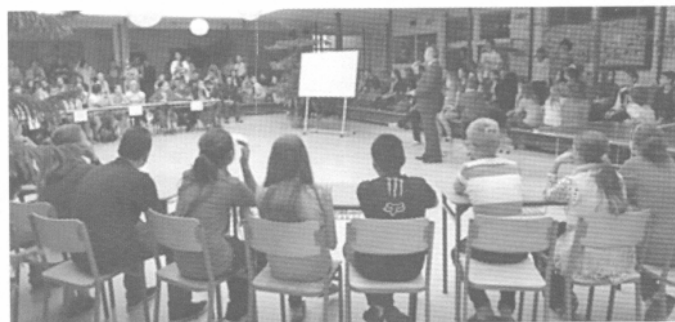
Družstvá na súťaži s environmentálnou tematikou