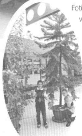
Kontrola čistoty v átriu školy