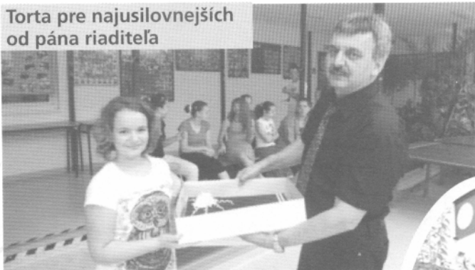
Torta pre najsilovnejších od pána riaditeľa