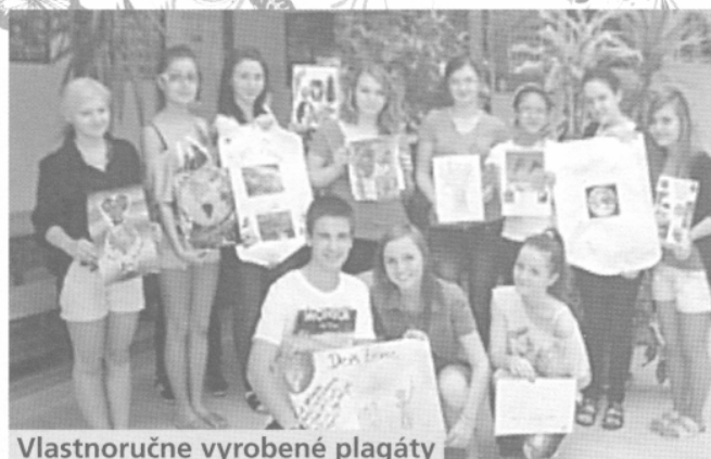
Vlastnoručne vyrobené plagáty

čo nás teší – vyhrala trieda Príma a trieda II.A s rovnakým počtom bodov.