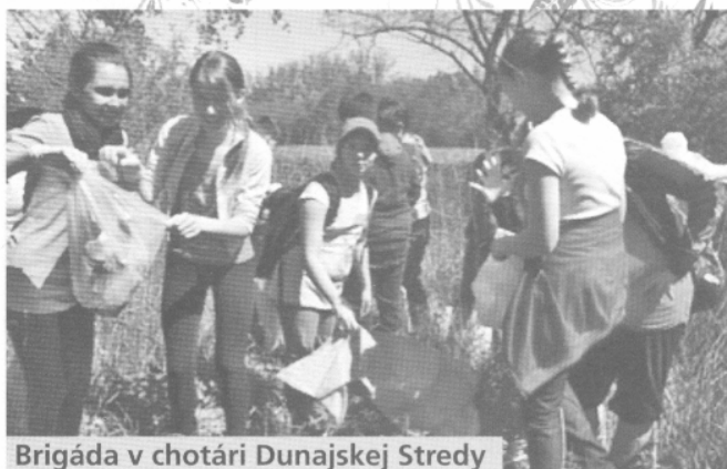
Brigáda v chotári Dunajskej Stredy