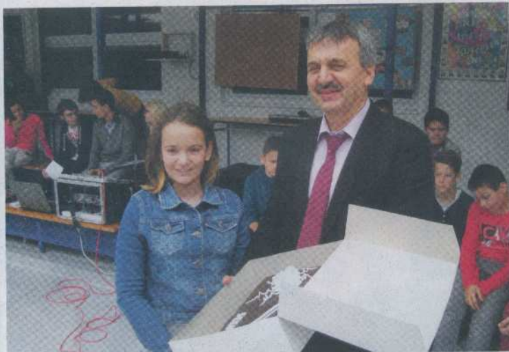
Najlepšími zberačmi papiera sa stali žiaci sekundy – sladká odmena ich neminula

som v poslednom ročníku, je to také pekné zakončenie jednej kapitoly na tejto škole.