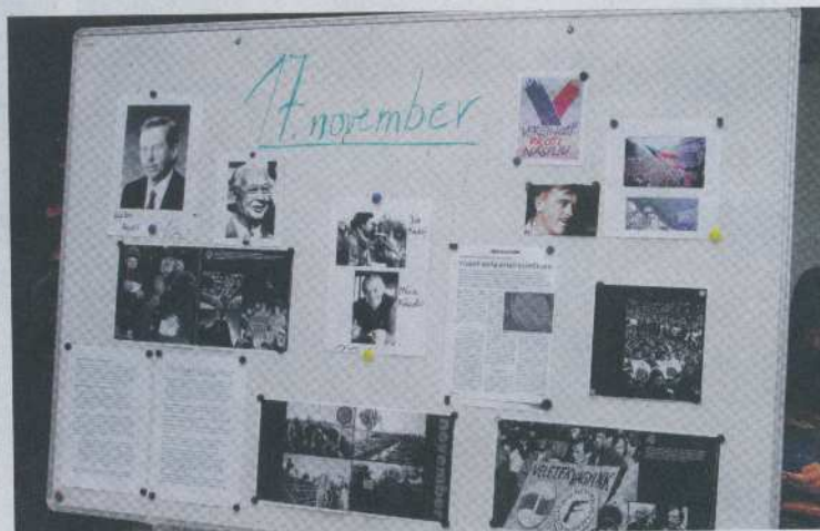
Nezabudlo sa ani na udalosti z novembra 1989